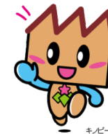
群馬県 マスコットキャラクター 「キノビー」